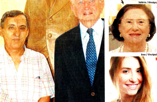
Volante / Divulgação