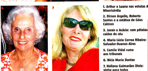
Enzo / Divulgação