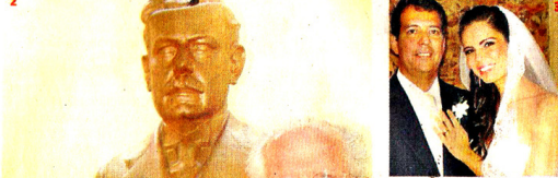
Album de família