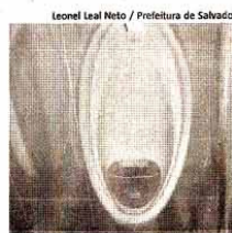
Leonel Leal Neto / Prefeitura de Salvador

Empresas aproveitaram o tema do futebol para fabricar até utilitários para mictórios